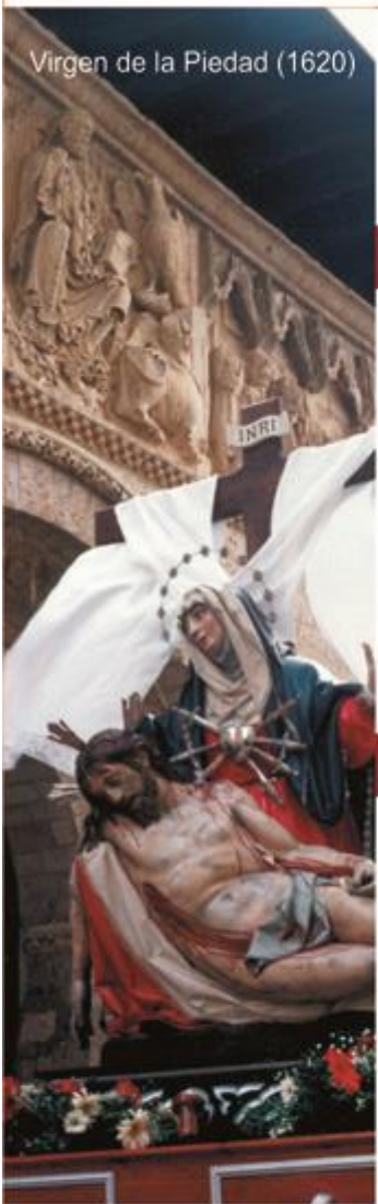
Virgen de la Piedad (1620)