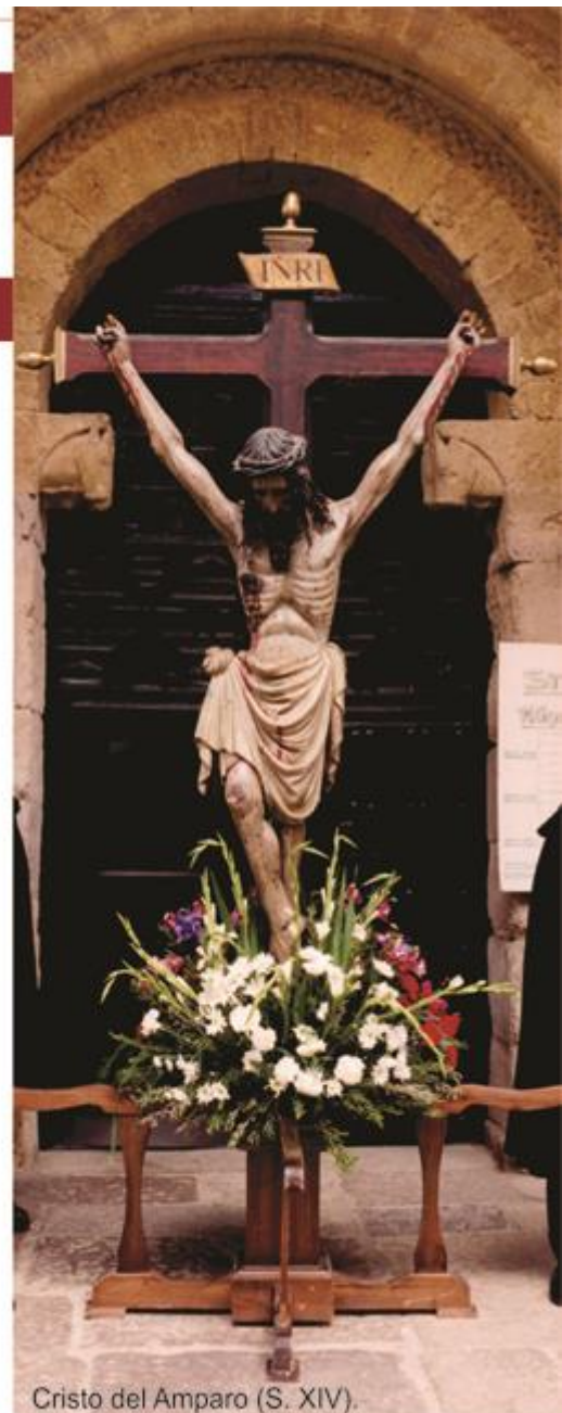
Cristo del Amparo (S. XIV).