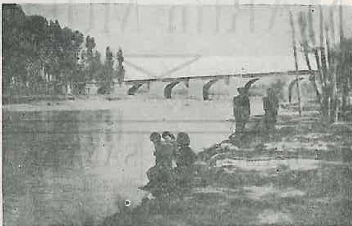
Vista del río y Puente

A las cinco de la tarde, visita a los sepulcros descubiertos recientemente en el convento de San Zoilo.