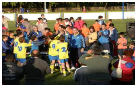
Foto Torneo Ciudad de Carrión

Ayuntamiento (subvención), padres (cuota), patrocinadores y sobre todo los directivos que buscan otros recursos (lotería, bingos...), son la base para cubrir los 26.000 € que tiene de presupuesto la escuela.