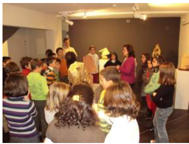
Foto visita del CP Marqués de Santillana de Carrión de los Condes.

El objetivo de esta iniciativa es fomentar el interés de los alumnos por el arte contemporáneo. Las visitas son dirigidas a través de actividades que invitan a la diversión en el museo como medio de aprender a disfrutar el arte.