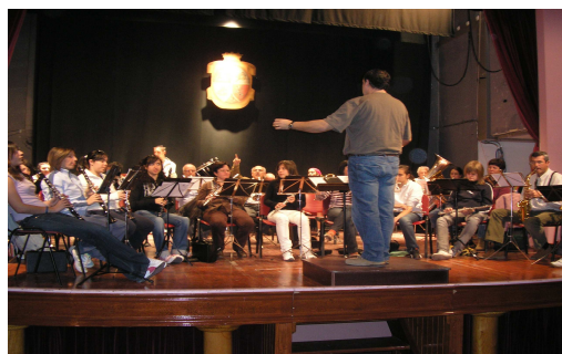
Foto de uno de los ensayos generales.

Ánimo a todos los niños a partir de 7 años, jóvenes y adultos de ambos sexos, para que os apuntéis a la academia y una vez creada la Escuela d Música, pasarán todos a formar parte de la misma, tocar un instrumento o pertenecer a la Escolanía Virgen de belén o a la Coral Carrionesa, ambas agrupaciones en perfecto funcionamiento.