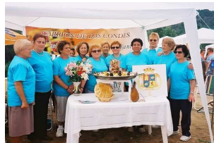
Foto de algunas socias de la asociación en el XV concurso de paella el 03 de julio en Cascares.

Gratuita. Inscripciones en la Sede de la Asociación.