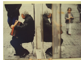
Foto ganadora II Concejo de Arte Joven 2011 Ciudad Carrión de los Condes. Título "El Reflejo"

Toda la programación de navidad de la casa de jóvenes irá incluida dentro del programa navideño del Ayuntamiento.