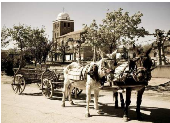
Foto: Carro antiguo, de Torío, San Mames de Campos.

Por último destacar la colaboración en esta feria del Taller de Mejora Profesional de Jardinería, donde mostrarán su trabajo y zonas de actuación realizadas hasta la fecha.